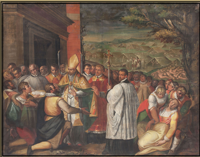
Charles Borromée administre les sacrements aux pestiférés, fresque de Camillo Landriani di ' Il Duchino ', 1602, Cathédrale de Milan

« L' évêque face à son métier : administrer le diocèse en Lotharingie-Dorsale catholique X e - XVIII e siècles »