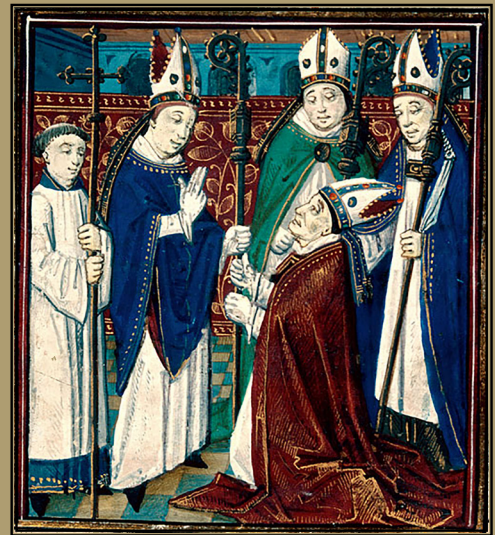
Consécration d'un évêque. BM Besançon, ms. 115, fol. 34v. (XV e siècle)