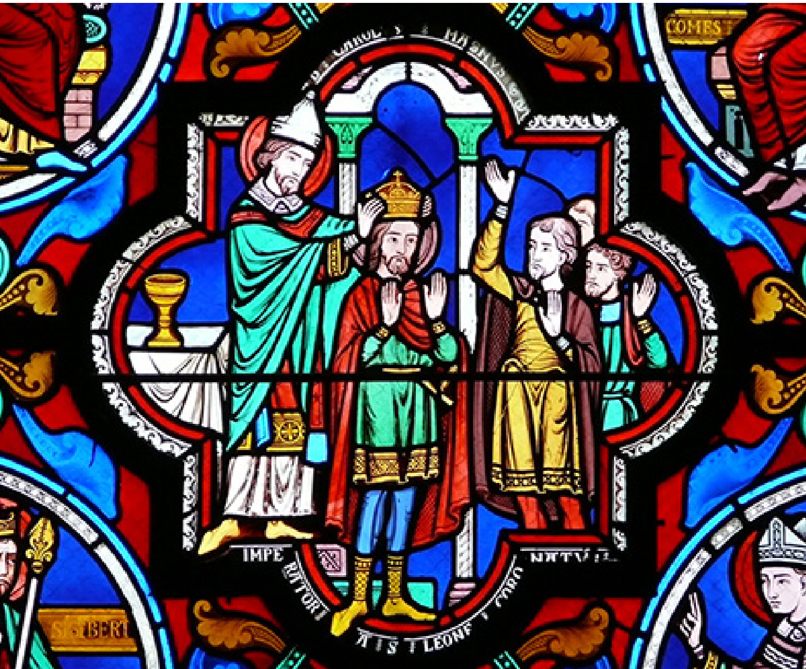
Illustration : Vitrail - Sacre Charlemagne-Poitiers, Sainte Radegonde-France