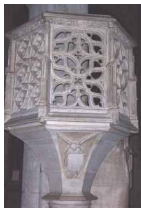
Chaire à prêcher, XV e siècle Cathédrale Saint Jean de Besançon