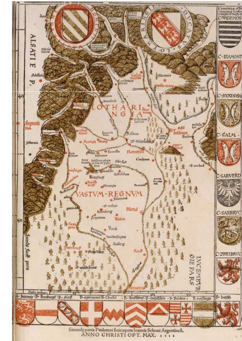
BnF, Cartes et plans, GE DD 2043 RES, Carte de la Lorraine (1513)

Salle de la MSH, 4 ème étage UFR Sciences Humaines et Arts