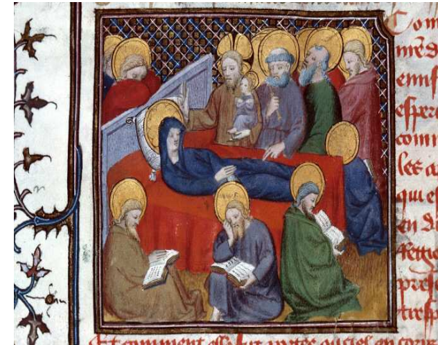
La mort de la Vierge , BM Besançon ms. 550, fol. 88v