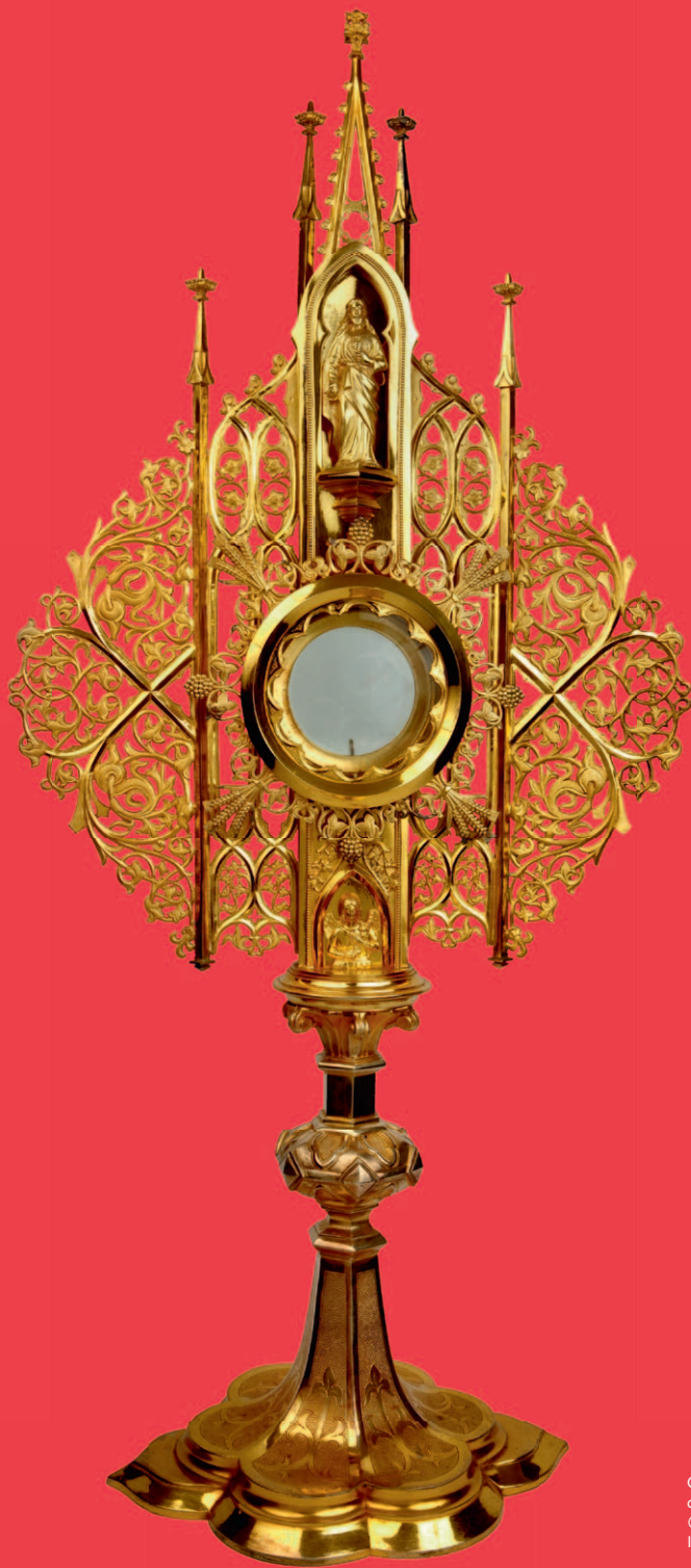
Ostensoir, église de Basse-Ham, Moselle