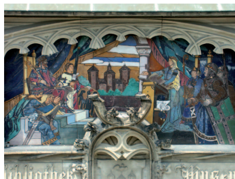
Détail extérieur du musée historique de Haguenau

« Le palais de justice de Mulhouse (1899-1902), une œuvre d'art total et de transition »