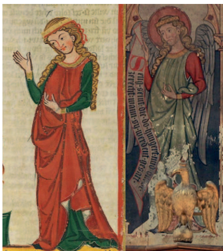
Enluminure du Codex Manesse (à droite) et peinture murale de l'église Saint-Pierre-le-Jeune de Strasbourg (à gauche) © Anne Vuilleumard-Jenn

« Regard sur le musée des Monuments français : une néo-architecture du collage comme ressource pour la formation d'un nouvel éclectisme »