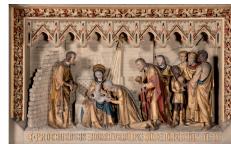
Retable de la Vierge (Adoration des Mages), collégiale Notre-Dame-et-Saint-Domitien, Huy (Belgique).