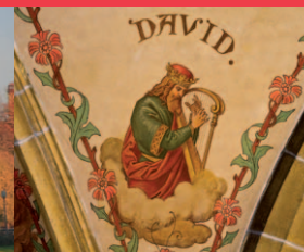
Église Sainte-Ségolène 14, rue des Capucins