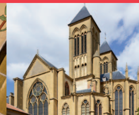
Basilique Saint-Vincent Place Saint-Vincent