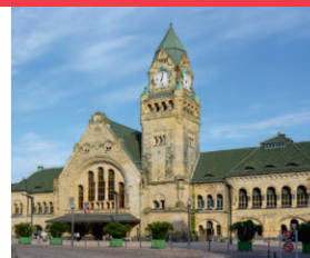
Gare de Metz 3, place du Général de Gaulle

— L'abbatiale Saint-Vincent de Metz est construite à partir de 1248 par l'abbé Warin dans un style gothique. L'incendie de 1752 provoqua l'effondrement de la tour sur la façade et deux travées de la nef. Celles-ci furent reconstruites en reprenant les principes esthétiques et techniques des travées médiévales dans un souci d'homogénéité. Cette survivance des formes contraste avec la façade qui adopte un style classique.