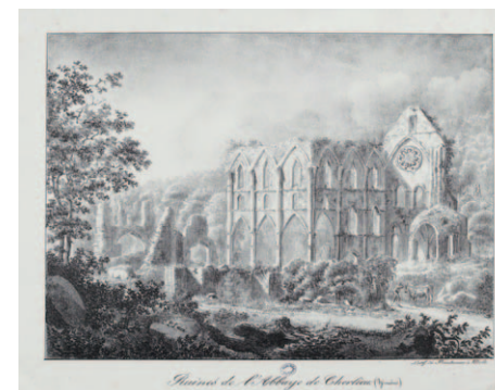
Lithographie de l'abbaye de Cherlieu, milieu du XIX e siècle, archives municipales de Besançon.