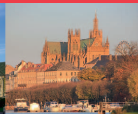
Cathédrale Saint-Étienne Place d'Armes