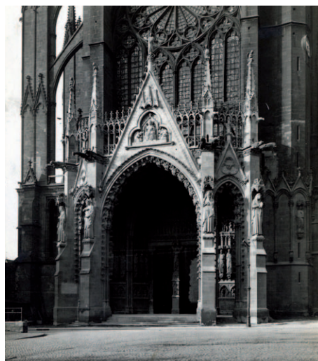
Cathédrale Saint-Étienne de Metz – Portail occidental