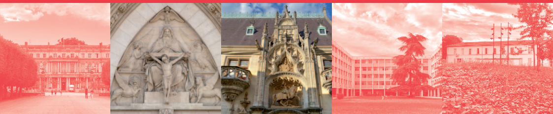
Palais du Gouvernement Hémicycle du Général de Gaulle Église Saint-Epvre Place Saint-Epvre Palais ducal Grande-Rue Campus Lettres et Sciences Humaines Université de Lorraine Salle A104 23, boulevard Albert 1 er Centre des Mémoires Michel Dinet 2, rue Jean-Baptiste Thierry Solet