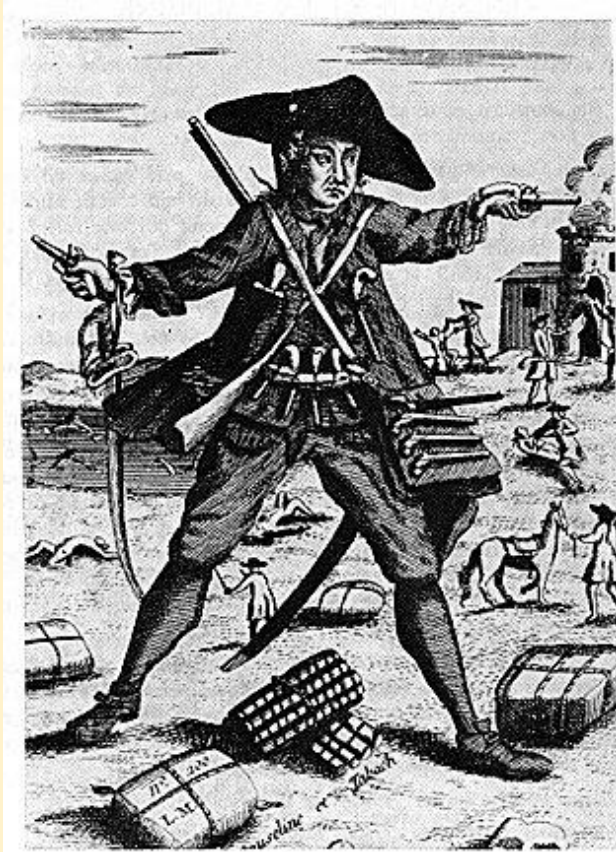
Mandrin et ses ballots de tabac Dessin anonyme (Bibl. Nat.)

déterminer une baisse de cette pratique vers la fin de l'époque moderne ? Dans des cas de litiges avec des voisins outre-frontière, à qui en appelle-t-on ? Invoque-t-on une appartenance nationale ? La question est d'importance, particulièrement dans des espaces qui ont pu changer d'appartenance étatique et qui doivent se plier à de nouvelles règles. La thématique du commerce à l'aune de la frontière s'impose. Les traités et accords de limites du XVIII e siècle ne manquent pas d'invoquer les empêchements au commerce et, implicitement, la