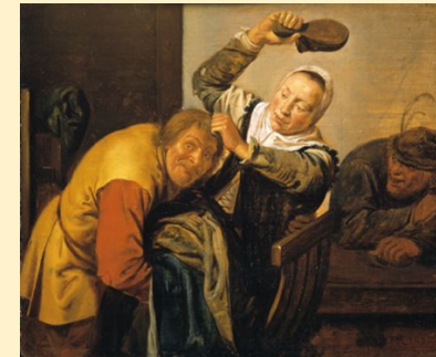
Jan Miense Molenaer, Los cinco sentidos, el tocar , 1637.